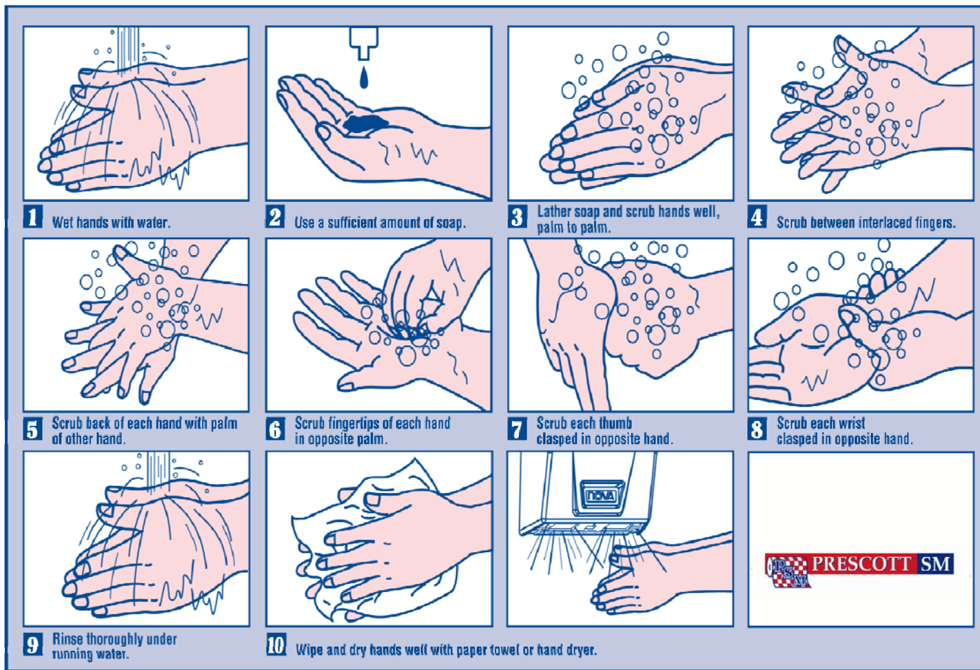
Schéma du lavage des mains